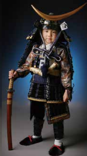
伊達政宗 兜 身長100～115 cm