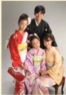
姉、兄の着物もあります。