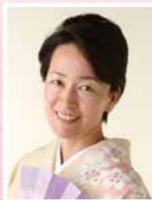
ショートアレンジ