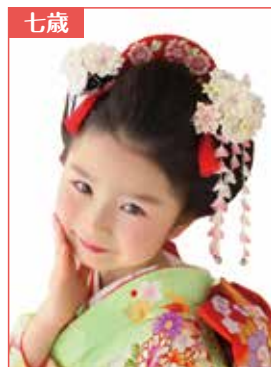
基本タイプ トップに櫛を