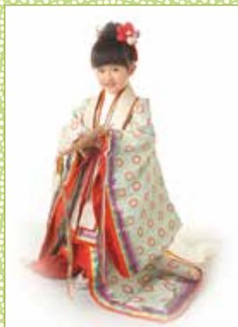
三歳 平安緑青(へいあんろくしょう)