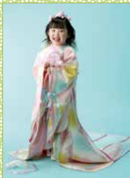
三歳 ふわふわ桃色