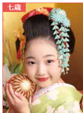
舞妓スタイル 舞妓用髪飾使用