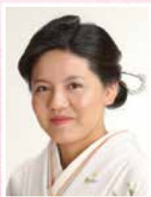
シンプルスタイル