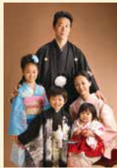
赤ちゃんの着物もあります。