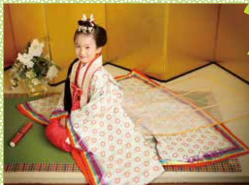
七歳 平安緑青(へいあんろくしょう)