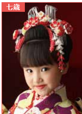
前髪を下ろすタイプ