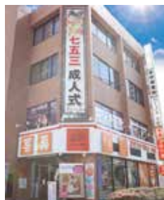
建物下が駐車場 (4 台)