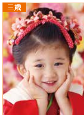
前髪を上げるタイプ