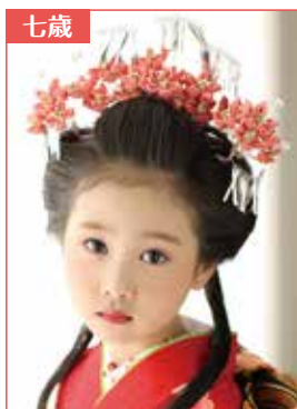
あんみつ姫スタイル