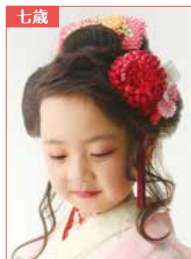
日本髪アレンジ サイドと髪飾り