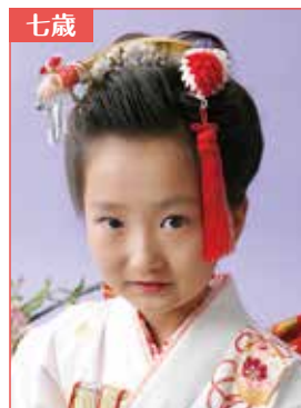
町娘風 サイド膨らみ小さめ