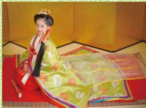
七歳 令和宮家装束(れいわみやけしょうぞく)