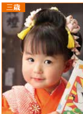
前髪を下ろすタイプ