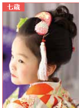
日本髪アレンジ バックが特徴