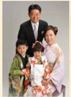
スーツのお父さんもいらっしゃいます。